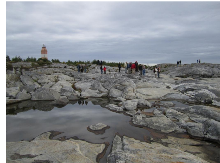
Sataveden ja Pro Saaristomeren kesäretki Isokariin, kuva: Johanna Rinne